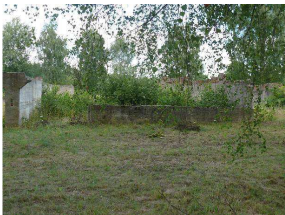
Widok na ścianę zewnętrzną strona południowa.