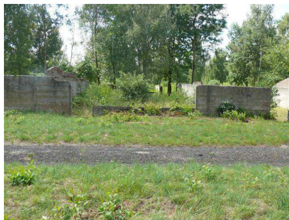
Widok na ścianę zewnętrzną strona północna.