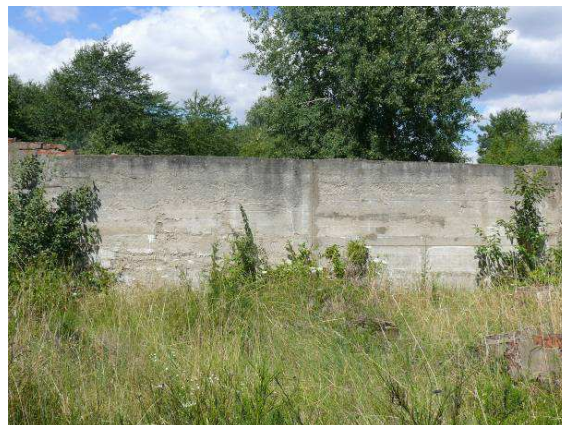
Widok na ścianę wewnętrzną strona zachodnia.