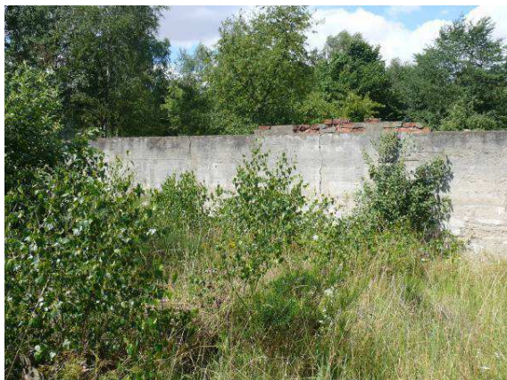
Widok na ścianę wewnętrzną strona zachodnia.