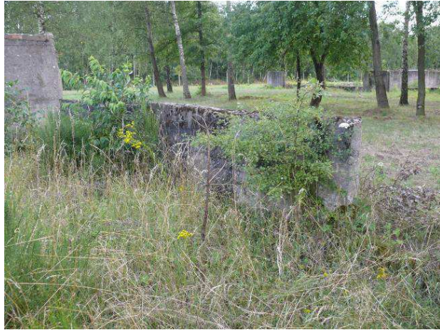
Widok na ścianę wewnętrzną strona południowa.