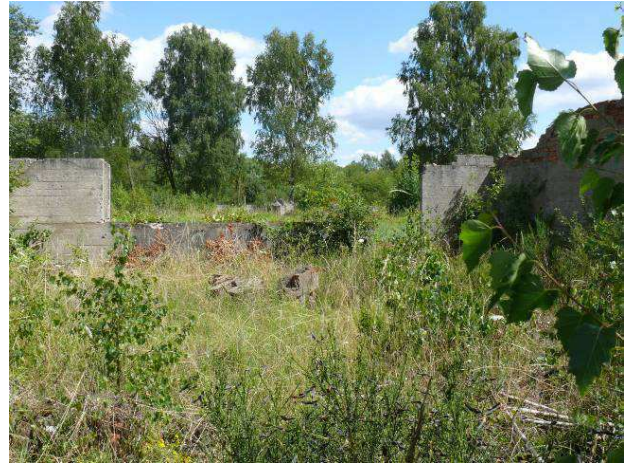
Widok na ścianę wewnętrzną strona północna.