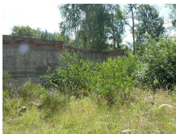
Widok na ścianę wewnętrzną strona wschodnia.