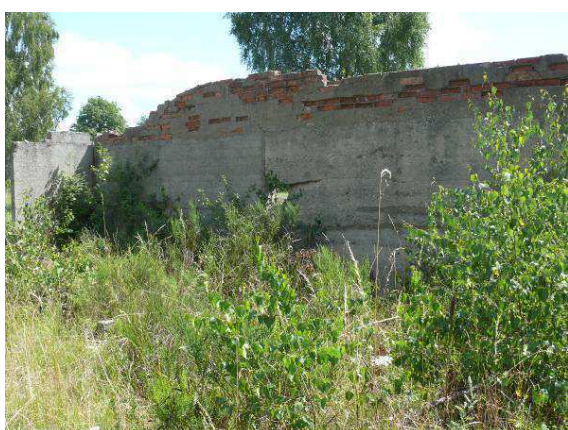
Widok na ścianę wewnętrzną strona wschodnia.