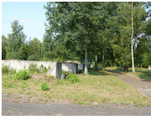
Widok na drogę wewnętrzną pomiędzy barakiem nr 6 i 7w kierunku zachodnim.