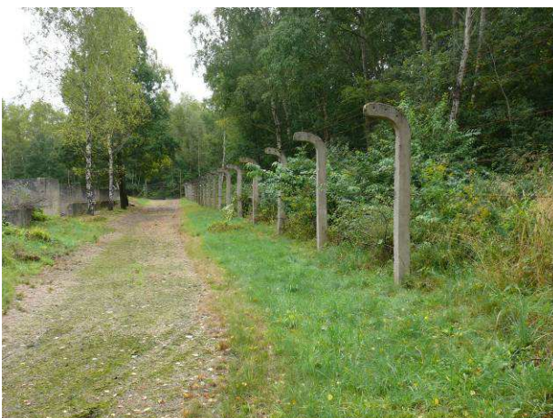
Widok na drogę wewnętrzną w zachodniej części obozu.