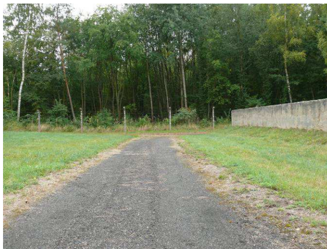
Widok na drogę wewnętrzną wschodnią w kierunku południowym.