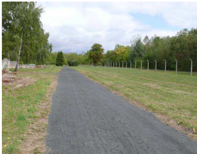
Widok na drogę wewnętrzną wschodnią w kierunku północnym.