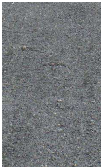
Zbliżenie na nawierzchnię z gysu bazaltowego - droga wewnętrzna .