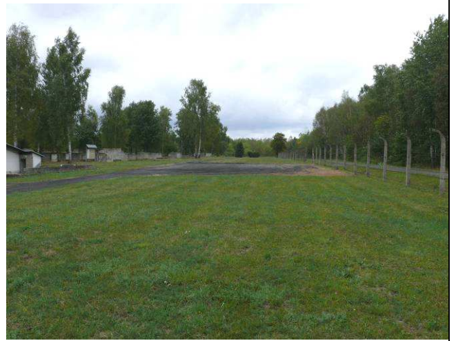
Widok na plac parkingowy wewnątrz obozu.