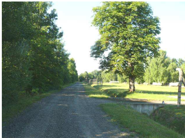
Widok na drogę zewnętrzną prowadzącą z miejscowości Szadurczyce poprzez Pomnik Martyrologii Jeńców Wojennych do Łąbinowic.