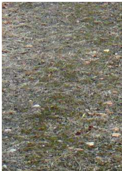
Zbliżenie na nawierzchnię z żużla - droga wewnętrzna.