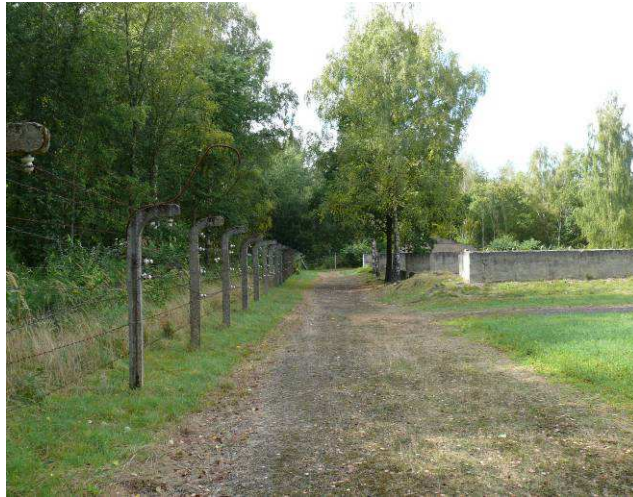
Widok na drogę wewnętrzną południową w kierunku zachodnim.