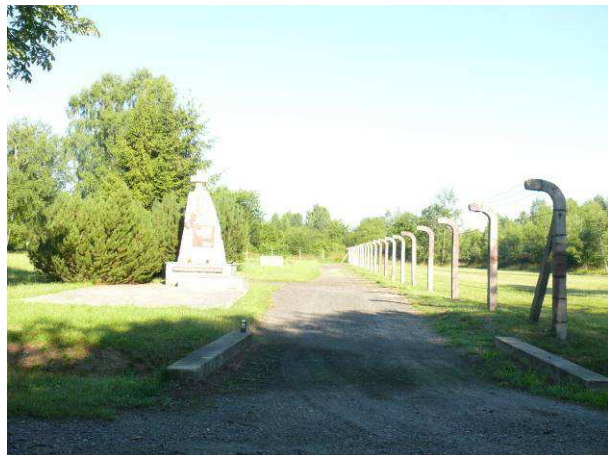
Widok na drogę wewnętrzną i wjazd w północnej części obozu.