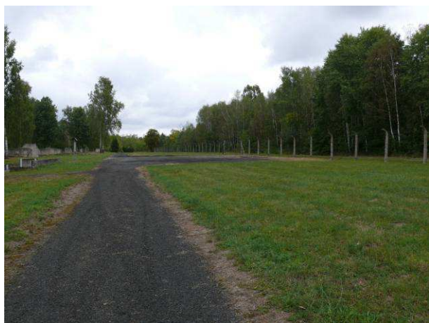
Widok na drogę wewnętrzną wschodnią w kierunku północnym.