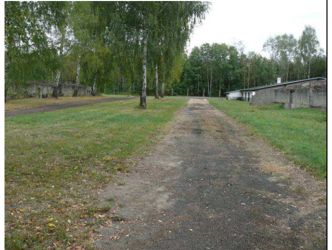
Widok na drogi wewnętrzne pomiędzy barakiem nr 3 i 4 w kierunku wschodnim.